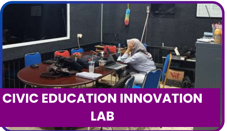
CIVIC EDUCATION INNOVATION LAB