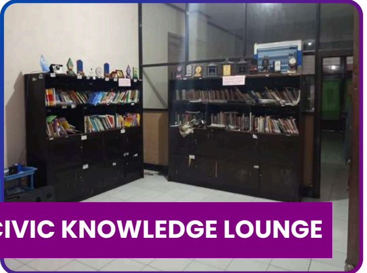
CIVIC KNOWLEDGE LOUNGE